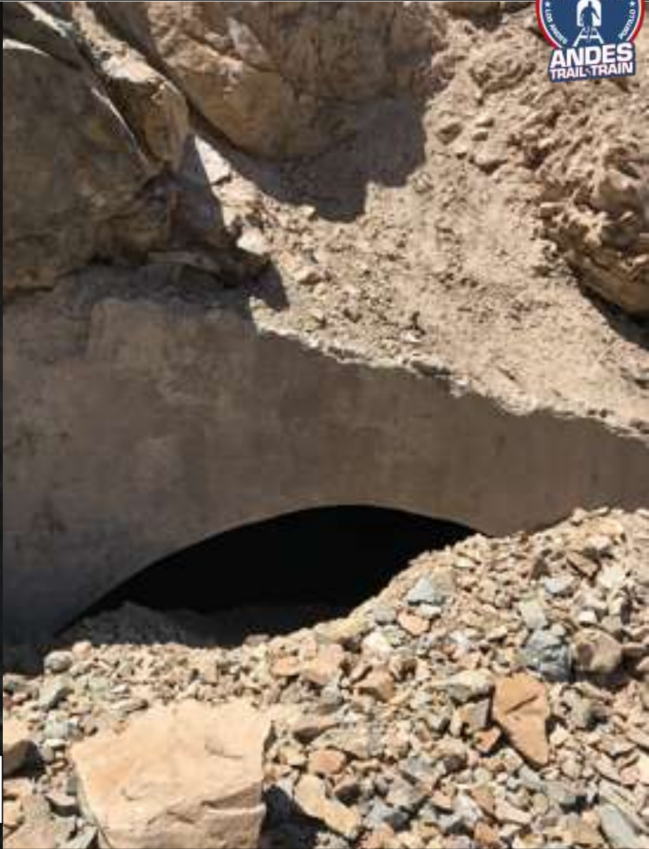
UNO DE LOS TUNELES TIENE UNA SALIDA ESTRECHA DONDE HAY QUE AGACHARSE O GATEAR. NO REVISTE PELIGRO