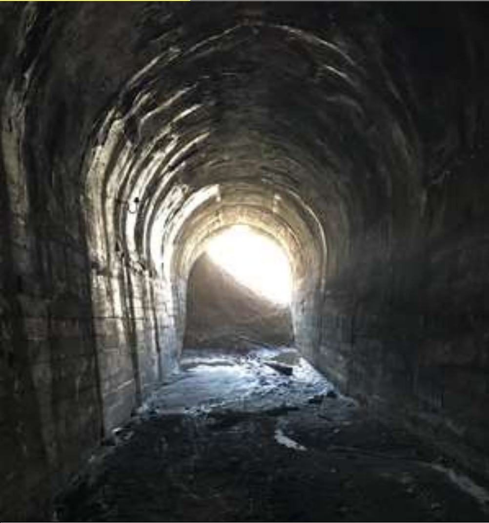
UNO DE LOS TUNELES TIENE UNA INUNDACION MENOR, ES INEVITABLE MOJARSE LAS ZAPATILLAS PERO NO ALCANZA A LOS TOBILLOS